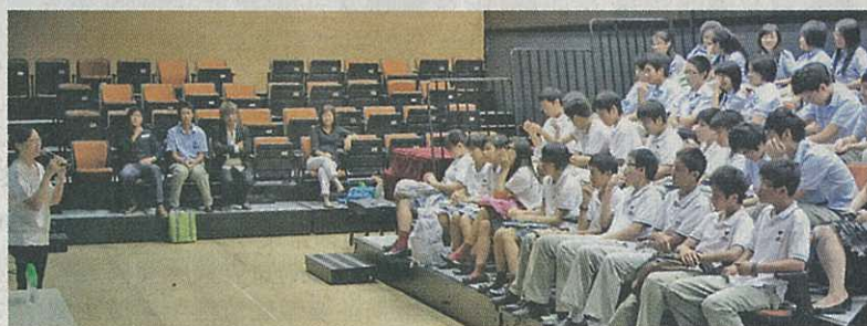
滬江維多利亞學校建有小型劇院，讓學生舉辦簡報會、戲劇或音樂等活動，助他們多元發展，配套IB課程的靈活要求。